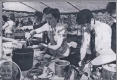
W TRAKCIE IMPREZY NIE ZABRAKŁO ANI GAWĘDY ANI CHLEBA ZE ŻMIŁCEM I ODOBKIEM...