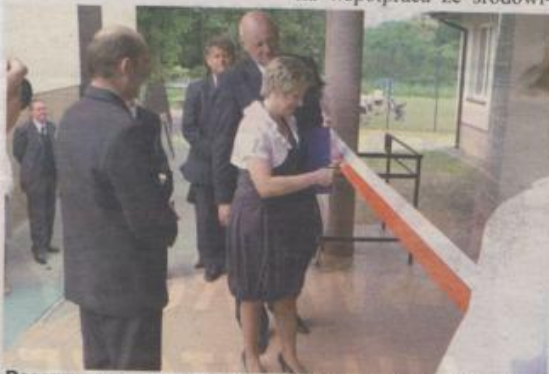
POPRAZ PRZECIĘCIE SYMBOLICZNEJ WSTĘGI ZOSTAŁA OTWARTA BIBLIOTEKA