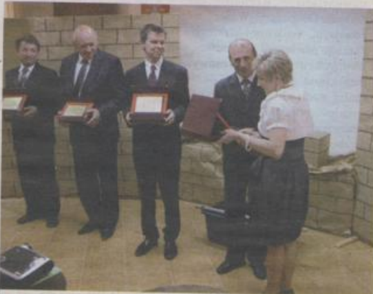
NA UROCZYSTOŚCI ZOSTAŁY WRĘCZONE PODZIĘKOWANIA ZA POMOC W MODERNIZACJI BIBLIOTEKI

– Biblioteka służy nam wszystkim, tym młodszym – uczącym się, starszym – chcącym doskonalić swoje kwalifikacje zawodowe i tym, którzy w książkach szukają rozrywki intelektualnej i duchowej. Szczególną rolę w tworzeniu i ocalaniu dorobku kulturalnego pełni książka. Jest ona przekaznikiem myśli ludzkiej, w słowie pisany zawarty jest najszerszy dorobek artystyczny