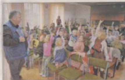
Dzieci na wycieczki odgadywały zagadki

- Było bardzo fajnie. Zgadywaliśmy zakończenia bajek