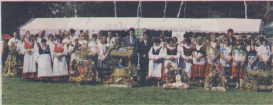
Pokaz wieńców dożynkowych