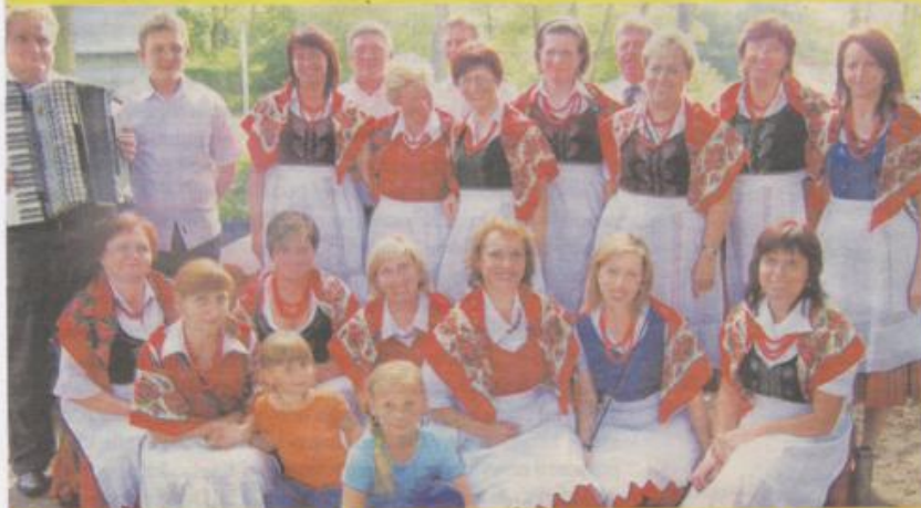
Zespół ludowy z Łaszewa działający przy Kole Gospodyń Wiejskich jak zwykle z uśmiechem

Już po raz 13 odbył się Przegląd Folkloru Ziemi Wieluńskiej. Zbiegiem okoliczności może wydawać się fakt, że na scenie w Osjakowie ludowy repertuar zaprezentowało 13 zespołów. Owa "13" zdaniem organizatorów była szczęśliwa i zapewniła dobrą zabawę i sprzyjającą pogodę.