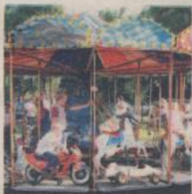
W Osjakowie nie zabraknie atrakcji dla dzieci

Znany jest już program Dnia Osjakowa. Impreza odbędzie się w niedzielę 19 czerwca. Na stadionie sportowym klubu Warta na początek zaplanowano program dla dzieci pod nazwą „Och Tośka”. Następnie na scenie zaprezentuje się kabaret Paka, po nim zagra zespół Milano, a na koniec odbędzie się koncert życzeń. Początek imprezy o godz. 16. Początek imprezy ryb