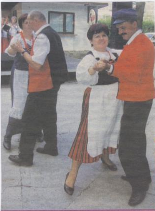
Członkowie zespołów ludowych porwali do tańca ...