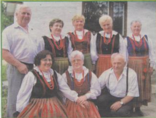
Zespół Nadwarcianki z Konopnicy oczarował śpiewem