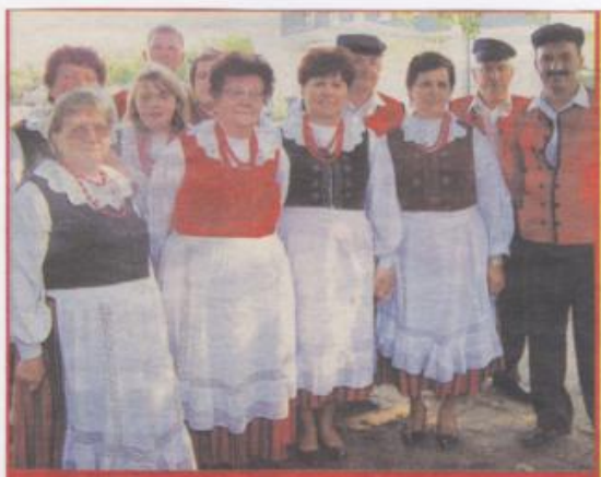
Roztańczony Zespół Ludowy Opojowanie z Opojowic