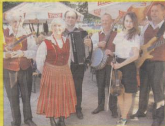
Niezawodna Kapela Ludowa Konopniczanie