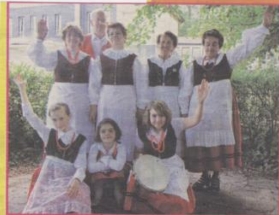
Zespół Pieśni Ludowej z Dębiny pozdrawia czytelników