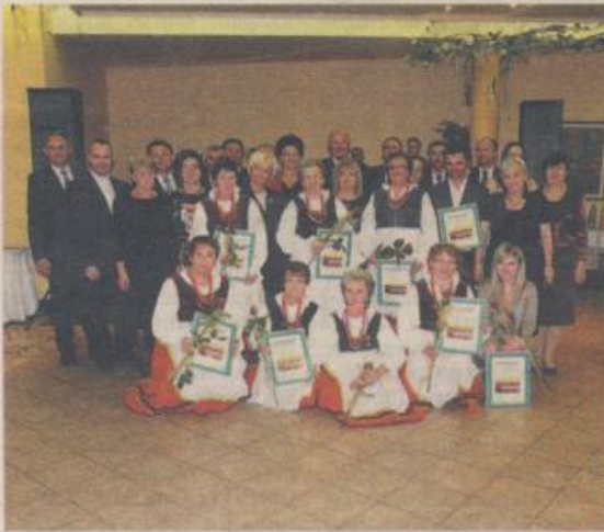
Podczas jubileuszu nie zabrakło pamiątkowego zdjęcia z gośćmi