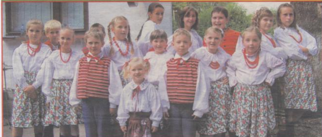
Ludowy Zespół Dziecięcy z Konopnicy zaczarował wszystkich magią ludowych strojów, melodii i tańców