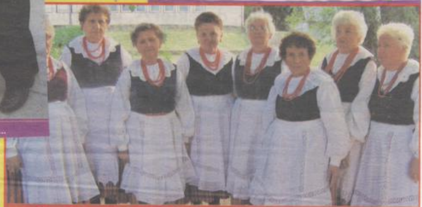
Zespół Śpiewaczy z Białej zabawiał swoimi przyspiewkami jak mógł