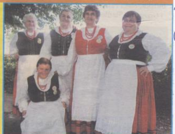
Zespół Pieśni Ludowej z Chorzyny czyli zadziorne dziewczyny