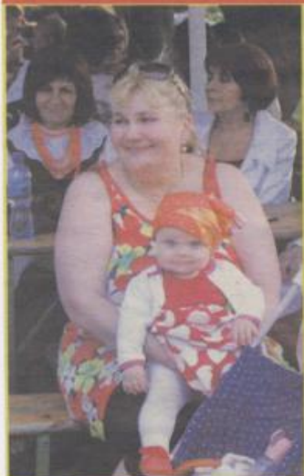
Najmłodsza artystka ludowa