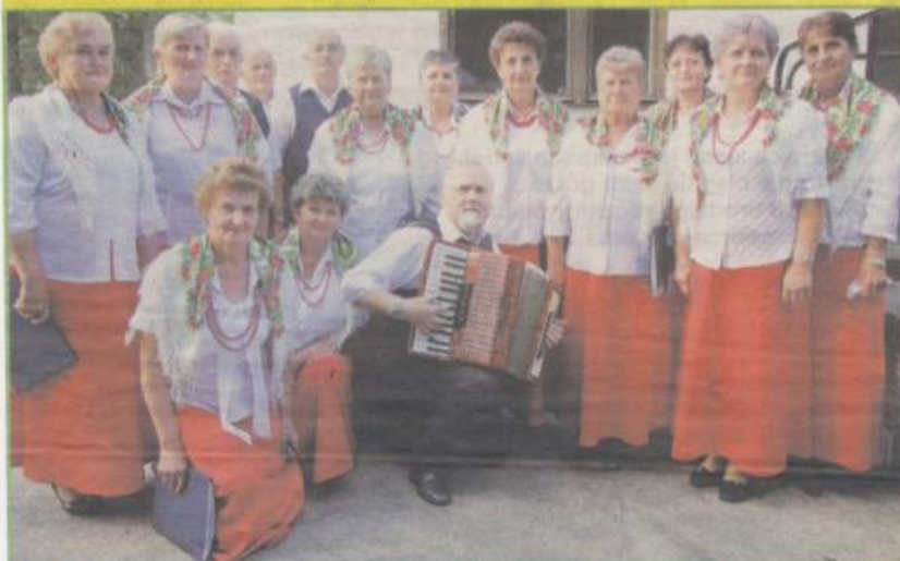
Zespół Śpiewaczy Włościanie z Chotowa dali czadu na osjakowej scenie