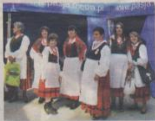
Zespół śpiewaczy w Dębiny w gminie Osjaków

Pielegnowanie lokalnych tradycji – przekazywanie jej wzorów młodszemu pokoleniu.